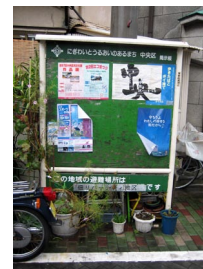
写真-2 地域の掲示板