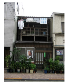
写真-3 木造家屋（長屋）