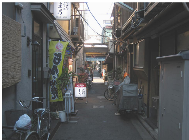
写真 - 5 予備実験対象街路 (月島)