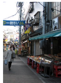
写真-1 路上に陳列された商品