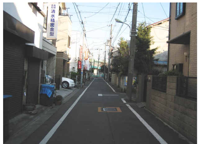
写真-7 比較的要素の少ない街路(西六郷)