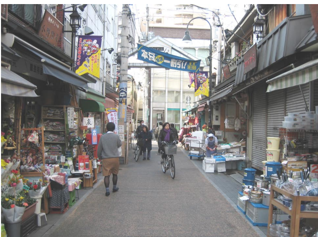
写真 - 4 予備実験対象街路 (谷中)

者に示し街路の評価をさせた (印象評価)。評価は下町らしさを最低0点から最高4点の5段階とした。その際、下町らしさについての説明は行わず、各人の持っている下町らしさの基準に基づいて評価させた。また、街路ごとに下町らしさに影響を与えたと感じた要素を自由記述させた (グレイン判別)。