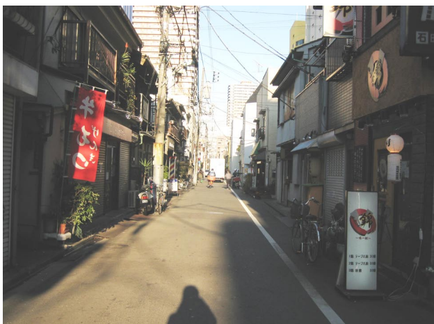
写真-6 比較的道幅の広い街路(月島)

これらの要素はそれぞれ大きさは同一ではないが、街路空間を構成する要素としてのスケールがそれほど違わないことから、先行研究 1) と同様、以降の分析においては大きさの違いを無視し、その数、分布に着目する。