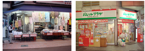
図-2 大須商店街店舗例

2-(2)で挙げた基準を満たした商店街の中で、調査協力を得られた大須商店街(筆者が幼少期を過ごした商店街)を事前調査の対象地とした(図-2)。